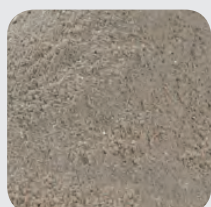
ILE DE FRANCE